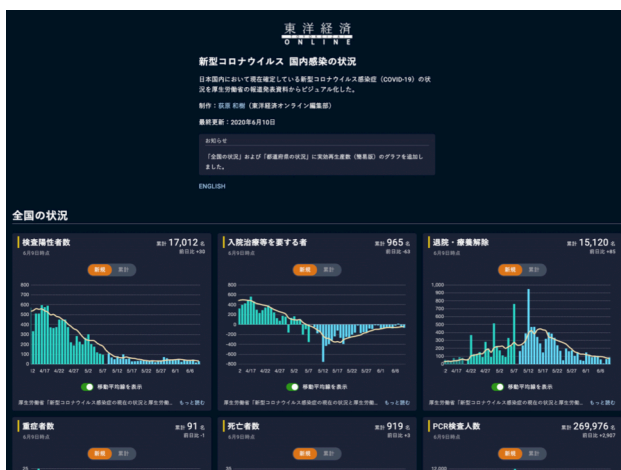
新型コロナ特別ページより抜粋

2月末に開設した特設ページ「国内『新型コロナウイルス』患者の発生状況」は毎日更新を続け、5月も多くの読者から定期的な訪問がありました。一目で日本国内におけるコロナの感染状況や変遷がわかるデータビジュアルを駆使し、5月20日からは、リアルタイム性を重視した「実効再生産数」（1人の感染者が新たに何人に直接ウイルスを感染させるかの指標）の掲載も始めました。政府の専門家会議のメンバーである西浦博・北海道大学教授が考案した数理モデルを用い、報告日ベースで簡易的に割り出すという独自の取り組みです。